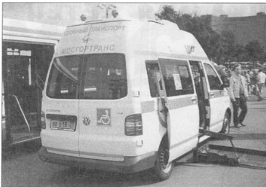
Москва. Удобный транспорт - инвалидам