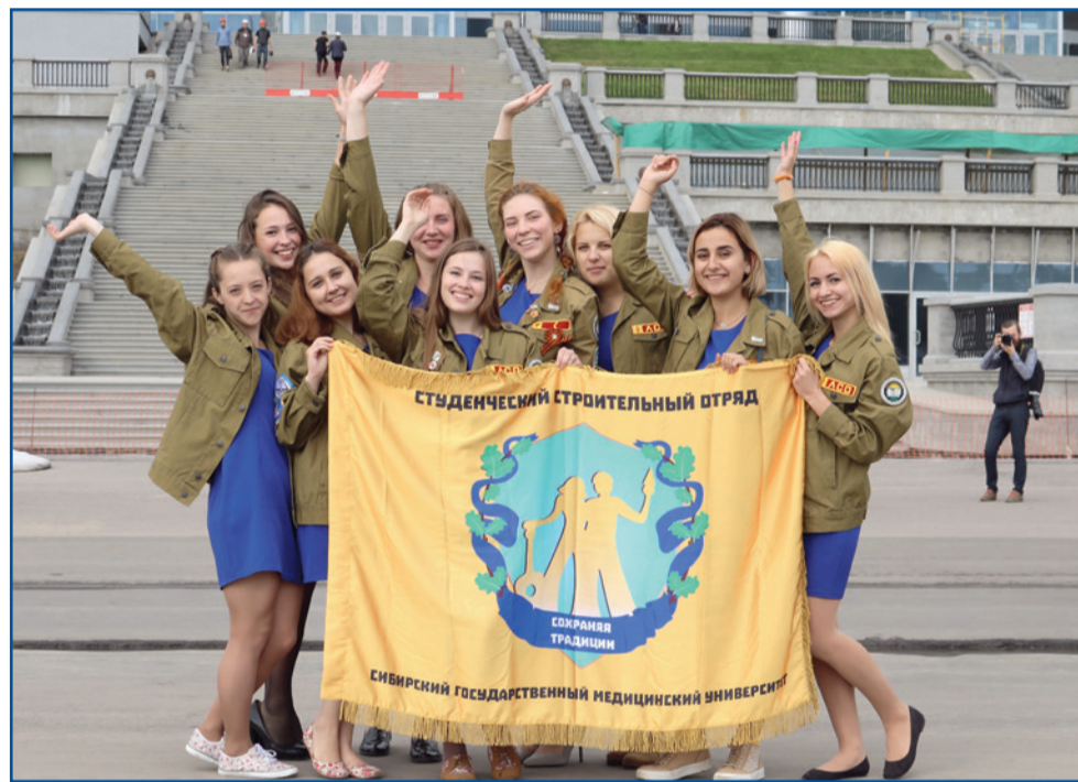
Бойцы отряда «Сохраняя традиции» на «Зенит-Арене»

– А каким вы видите идеального пассажира?