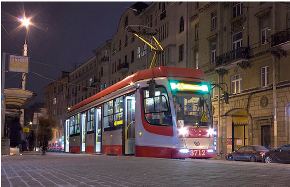
Повышенная посадочная площадка на Кронверкском проспекте

Здесь работают трамваи с интервалом, близким к частоте движения поездов метро. Это при том, что обособленные пути на проспекте Просвещения не ремонтировались уже 15 лет (там задолженность по ремонту ещё с 2015 года). А если сделать ремонт, то вырастет скорость, и обслуживать маршрут можно будет меньшим количеством подвижного состава. Поэтому сейчас планомерно проводятся капитальные ремонты для наших основных маршрутов.