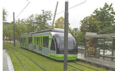
Трамвайная остановка в г. Бильбао (Испания)

могут разъезжаться на остановках, как например, в испанском Бильбао. Точно так же можно проехать по площади Победы. Кроме того, трамвай будет проще проехать под эстакадами, поскольку однопутка занимает в два раза меньше места. Это пример новых технологичных устройств пути на перегоне – однорельсовый путь с разъездами на остановках и электронным контролем безопасности. К слову, о безопасности. В Европе пешеход никогда не окажется один на один с автомобилями при выходе из трамвая на проезжую часть.