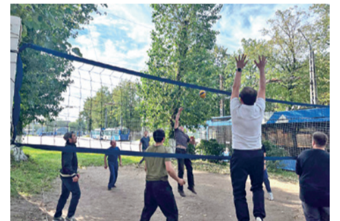
Работники Троллейбусного парка №3

Во многих сетка уже натянута, поле – оборудовано. Развивают парки и другие виды спорта. Например, в восьмом трамвайном готовят площадку для игры в городки, на очереди – установка стола для игры в теннис. А в третьем троллейбусном, в тёплое время, волейбол – приоритет. Когда погода не жалуется, коллеги «перезагружаются» от работы игрой в настольный теннис.