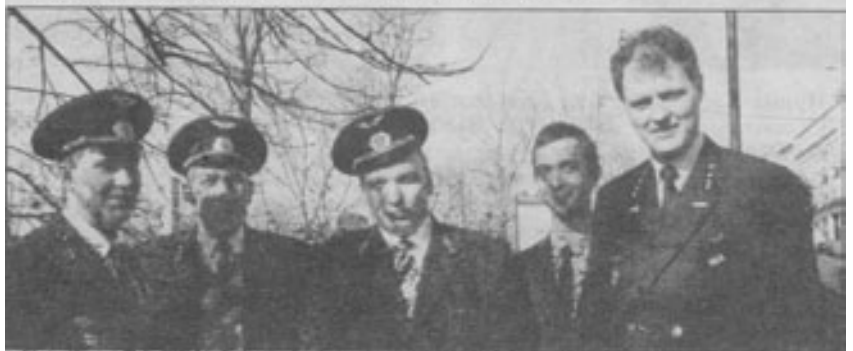
Бригада водителей ретротрамваев