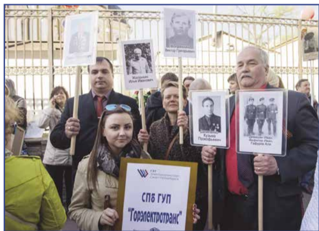
Работники «Горэлектротранса» в рядах Бессмертного полка

Колонны шли по Невскому проспекту под овации и приветствия около трёх часов. Среди тех, кто занял в строю полка место ушедших предков, были и работники петербургского «Горэлектротранса», рассказавшие о