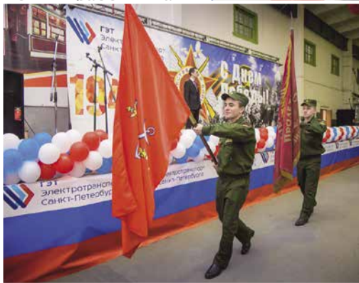
Вынос знамён на празднике для ветеранов.

музея для ветеранов была организована моментальная фотосъёмка, чтобы они могли прямо на месте сфотографироваться со своими друзьями и здесь же забрать свои снимки.