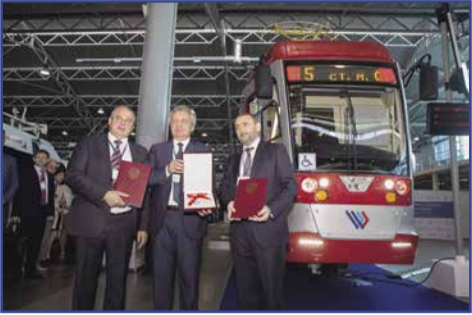
Вручение ключей от трамвая тактического назначения

«Горэлектротранс» в рамках первого Санкт-Петербургского международного инновационного форума пассажирского транспорта принял трамвай тактического назначения, представил уникальное оборудование и подписал 5 соглашений о стратегическом сотрудничестве. Стенд предприятия пользовался неизменной популярностью у гостей и участников выставки.