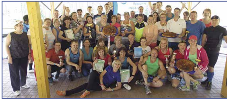
Окончание Спартакиады «Горэлектротранса»

21 июня в петербургском «Горэлектротрансе» состоялось главное спортивное событие, завершающее сезон – закрытие Спартакиады и награждение победителей. Соревнования продолжались с сентября 2014 года по июнь 2015 года и были посвящены 70-летию Великой Победы. В этом спортивном сезоне был поставлен рекорд по количеству команд-участниц: 18 коллективов состязались в 12 видах спорта. Практически каждая команда смогла завоевать в отдельных соревнованиях призовое место или стать лидером.