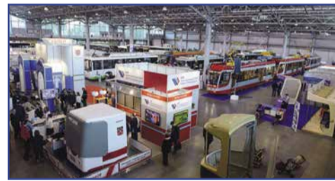
Стенд СПб ГУП «Горэлектротранс» на Санкт-Петербургском международном инновационном форуме пассажирского транспорта

логов в России учебный тренажёр водителя трамвая. Изготовленный специально для Петербурга, он позволяет в режиме реального времени имитировать работу водителя в кабине трамвая ЛМ-99. На открытии форума новинку протестировал вице-губернатор Игорь Албин – он попробовал себя в роли водителя трамвая, совершив пробную «поездку». Также на форуме «Горэлектротранс» представил продукцию собственного производства – «маску» трамвая, изготовленную в цехе композитных материалов. В рамках деловой программы СПб ГУП «Горэлектротранс» подписано пять соглашений о стратегическом сотрудничестве. В частности, с ОАО «Синара-транспортные машины» – о совместном участии в испытании технологии обеспечения увеличенного автономного хода трамвая в Санкт-Петербурге. Достигнута договоренность с ОАО «КАМАЗ» о проведении в нашем городе опытной эксплуатации электробуса КАМАЗ-52994Э. Ещё одно соглашение подписано с ЗАО «Штадлер-Минск», которое представило на испытания трех-