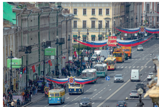
Старинные друзья Невского проспекта

Работники Горэлектротранса приняли участие в Первомайской демонстрации. Транспортники традиционно прошли по Невскому в составе колонны Межрегионального профсоюза работников жизнеобеспечения Санкт-Петербурга и Ленинградской области. Лозунг этого года: «Справедливая экономика – человеку труда».