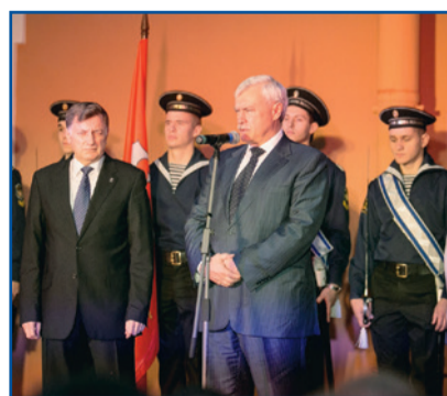
Губернатор Санкт-Петербурга Георгий Полтавченко и председатель Законодательного Собрания Вячеслав Макаров поздравляют членов МАП ГЭТ

Спикер Законодательного Собрания Петербурга Вячеслав Макаров отметил, что с развитием метро схема организации дорожного движения становится несколько иной, однако наземный электротранспорт продолжает выполнять функцию транспортных сосудов таких мегаполисов, как Петербург.