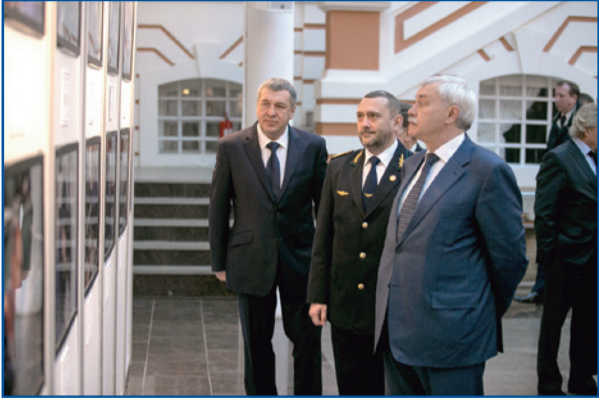
Губернатор Санкт-Петербурга Георгий Полтавченко, вице-губернатор Игорь Албин и директор СПб ГУП «Горэлектротранс» Василий Остряков осматривают выставку «Люди труда» в Петропавловской крепости.

Заместитель министра транспорта РФ Николай Асаул, поздравляя членов МАП ГЭТ с юбилеем, отметил, что отрасль городского наземного электрического транспорта носит ярко выраженный региональный характер.