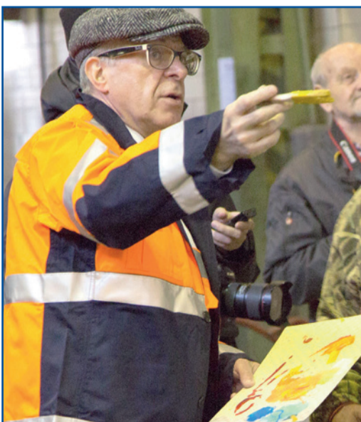
Андрей Ургант, актёр, телеведущий

– Мне вспоминаются слова из песни Вячеслава Добрынина: «Так будьте счастливы, друзья мои, пусть будут ясными все ваши дни, пусть ваши чувства будут сильными, дела красивыми, сердца достойными любви!» Как же это важно для всех!