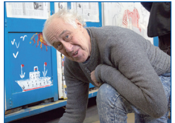
Народный артист Сергей Мигицко