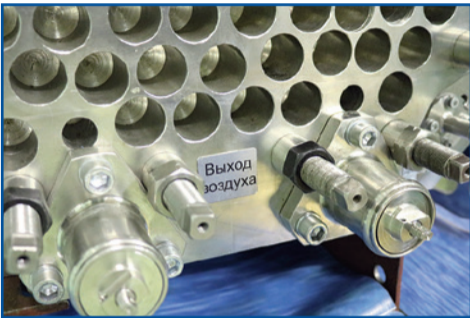
Водородная батарея (топливный элемент)

Наличие на выставке только этого новшества делает её суперзначимой. Было подписано четырёхстороннее соглашение между Горэлектротрансом, производителями трамваев, топливного элемента и привода. Думаю, что дата подписания этого соглашения может остаться в истории. Если мы когда-нибудь действительно перейдём на источники питания от водорода, то это изменит мир в целом.