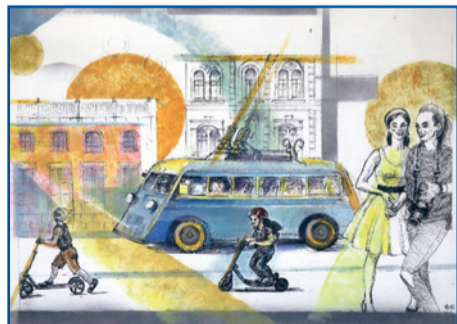
«Голубой троллейбус». Работа Елены Киселёвой. Бумага, смешанная техника

На выставке представлено более 40 произведений, выполненных в самых разных стилях. Всех авторов – живописцев, графиков, архитекторов, фотографов, дизайнеров, художников по стеклу и ткани – объединила тема экологического транспорта Петербурга, богатая факту-