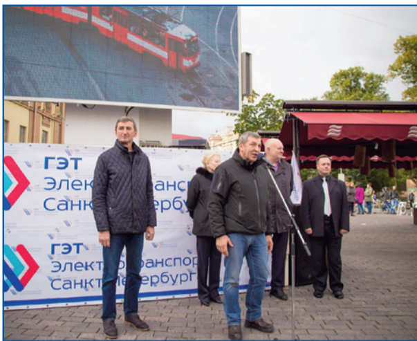
Вице-губернатор Санкт-Петербурга Игорь Албин открывает День без автомобиля

Вице-губернатор Санкт-Петербурга Игорь Албин , открывая на Манежной площади Всемирный день без автомобиля, напомнил, что население Земли в настоящее время превышает 7 с половиной млрд человек, а общее количество транспорта составляет более 1 млрд единиц, включая частные автомобили, автобусы и грузовой автотранспорт.