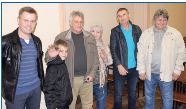
Команда Троллейбусного парка № 1 по дартсу

А 13 сентября спортсмены Горэлектротранса стартовали с победы в турнире по стритболу в рамках Спартакиады, проводимой Межрегиональным профсоюзом Санкт-Петербурга и Ленинградской области работников жилищно-коммунальных организаций и сферы обслуживания. «Серебро» взяла команда ГУП «ТЭК», замкнули тройку призёров представители Водоканала.