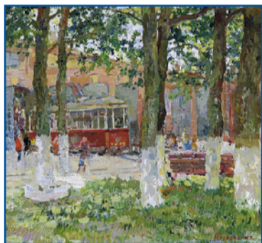
«Трамвайный парк». Работа Людмилы Баландиной. Холст, масло

Впрочем, для многих участников выставки электротранспорт – это не только объект для творчества, но и одно из самых ярких воспоминаний детства.