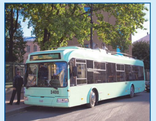
Троллейбус модели 32100D

Троллейбус модели 32100D относится к третьему поколению. Технические решения позволяют экономить до 45% энергопотребления в условиях городского цикла эксплуатации, а температурный режим эксплуатации троллейбуса на ЛТО-батареях достигает максимально адаптированных показателей для данного региона: от -40°С до +40°С. Пассажироместимость троллейбуса составляет 89 человек, в том числе 22 места для сидения.